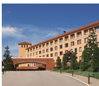
フルーツパーク 富士屋ホテル